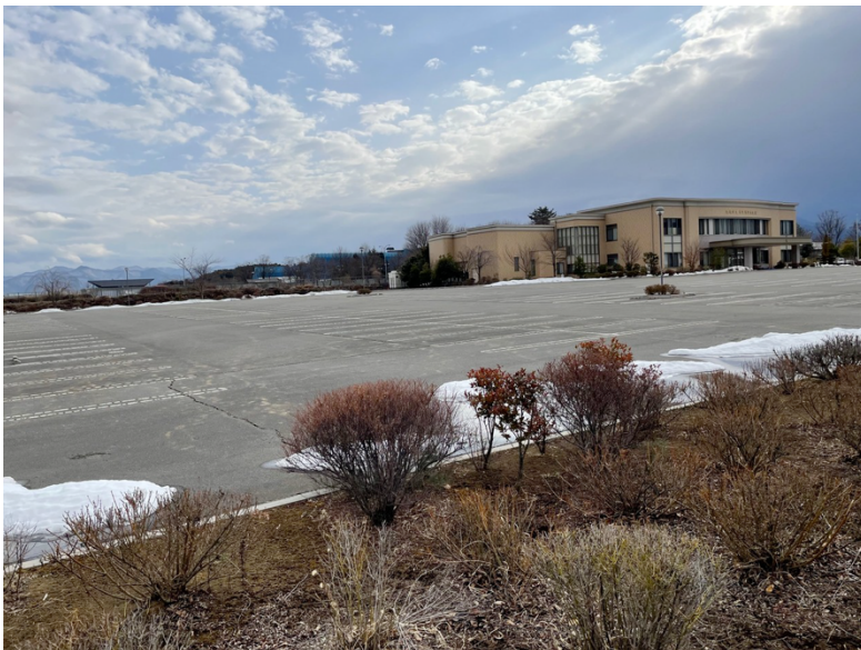
創価学会様駐車場