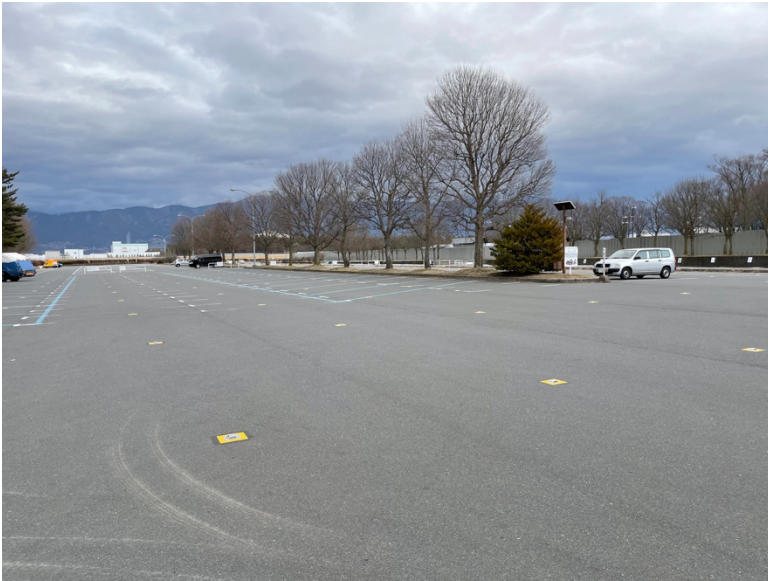
信州スカイパーク 1号駐車場