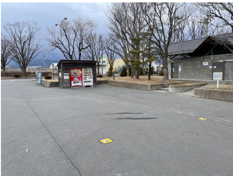
シャトルバス乗降場